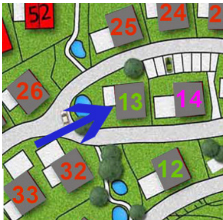
Carport chalet 13