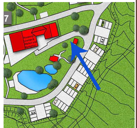
NPC receptie (alleen glas)